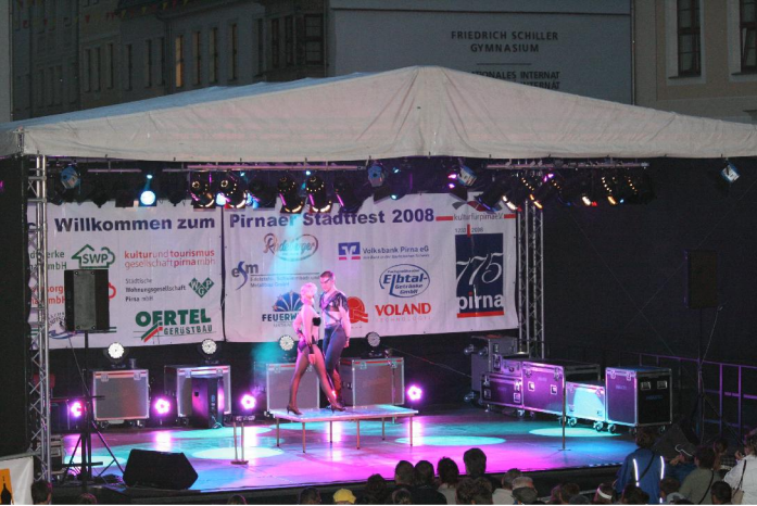
Bühnenrückwand Marktbühne, Stadtfest 2008