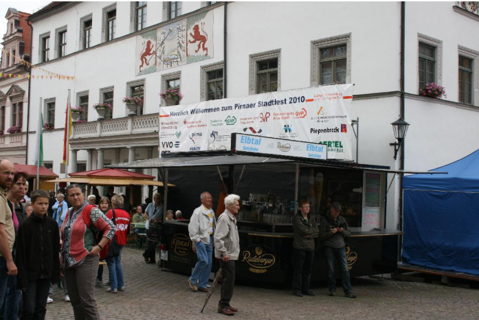
Sponsorenpräsentation Marktplatz, Stadtfest 2010