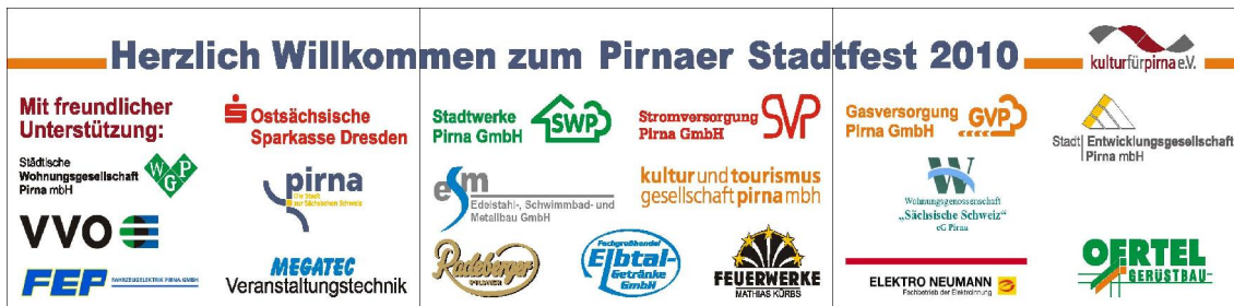
Schematische Darstellung der Bühnenrückwand 2010