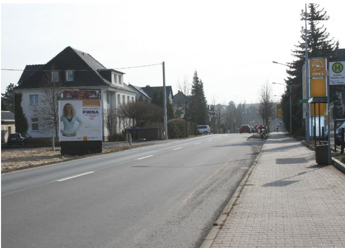
Standort Pillnitzer Straße, gegenüber Opel- Autohaus