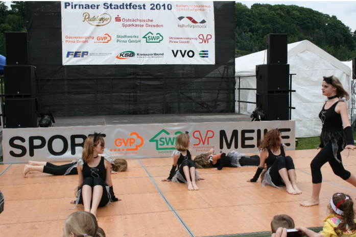
Bühnenrückwand Sportmeile Elbe, Stadtfest 2010