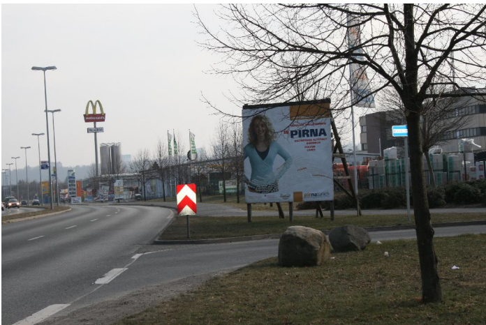
Standort B172/ Möbel Graf