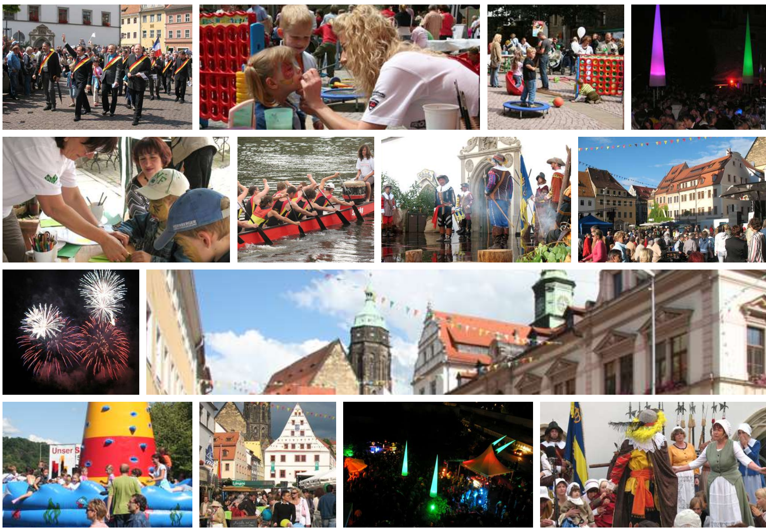
Gestaltung: www.spillergestaltung.de | Druck: Laske Druck Pirna

Veranstalter: Kultur- und Tourismusgesellschaft Pirna mbH